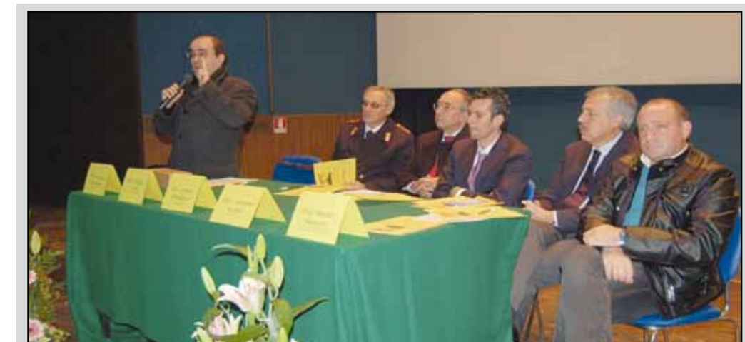
Conferenza cittadina su vita e sicurezza

L'amministrazione comunale di Ribera, intanto, ha coinvolto una ventina di comuni del comprensorio occidentale della provincia di Agrigento, con un progetto comune per bloccare la vendita di bevande alcoliche a minori, in qualsiasi orario della giornata e per unificare gli orari di esercizi commerciali, bar, ristoranti e soprattutto pub che, nella fascia oraria che va dalle 21 alle 6 del mattino, vendono