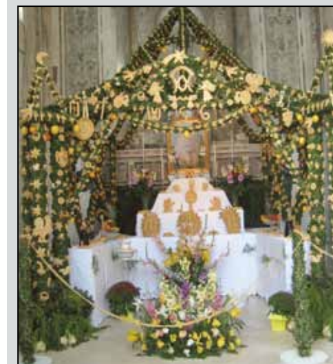
Altare di san Giuseppe

Anche l'associazione Pro Loco sarà protagonista in queste giornate con un