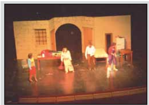
Un momento della commedia musicale "Pinocchio"

produzione interamente italiana per la cui rappresentazione complessa fu allestito appositamente un teatro. In secondo luogo per l'innovazione di tale scelta che sicuramente causerà una svolta epocale nella tradizione a venire delle riviste; tale rappresentazione è stata proposta, infatti, non con i soliti spettacoli mattutini riservati agli altri istituti superiori della città (occasione che ha sempre permesso agli studenti di "acquistare" un giorno di vacanza da scuola), ma attraverso degli spettacoli serali che hanno visto una grande affluenza di pubblico. Nella splendida cornice del teatro Selinus, gentilmente offerto dall'amministrazione comunale, i giovani attori, improvvisandosi tali, hanno intrattenuto il pubblico con uno spettacolo adatto a tutta la famiglia divertendo, commuovendo e riuscendo a trascinare lo spettatore con canzoni e balletti che restano nel cuore. Risulta impossibile, infatti, rimanere impassibili di fronte alla meraviglia che da sempre suscita la favola di Collodi, che riesce a rendere il suo messaggio attuale in ogni epoca e soprattutto in una società come la nostra spesso incline al compromesso e alla facile bugia. La storia di un burattino che rappresenta il bambino in ognuno di noi, il quale, ricorrendo ad una