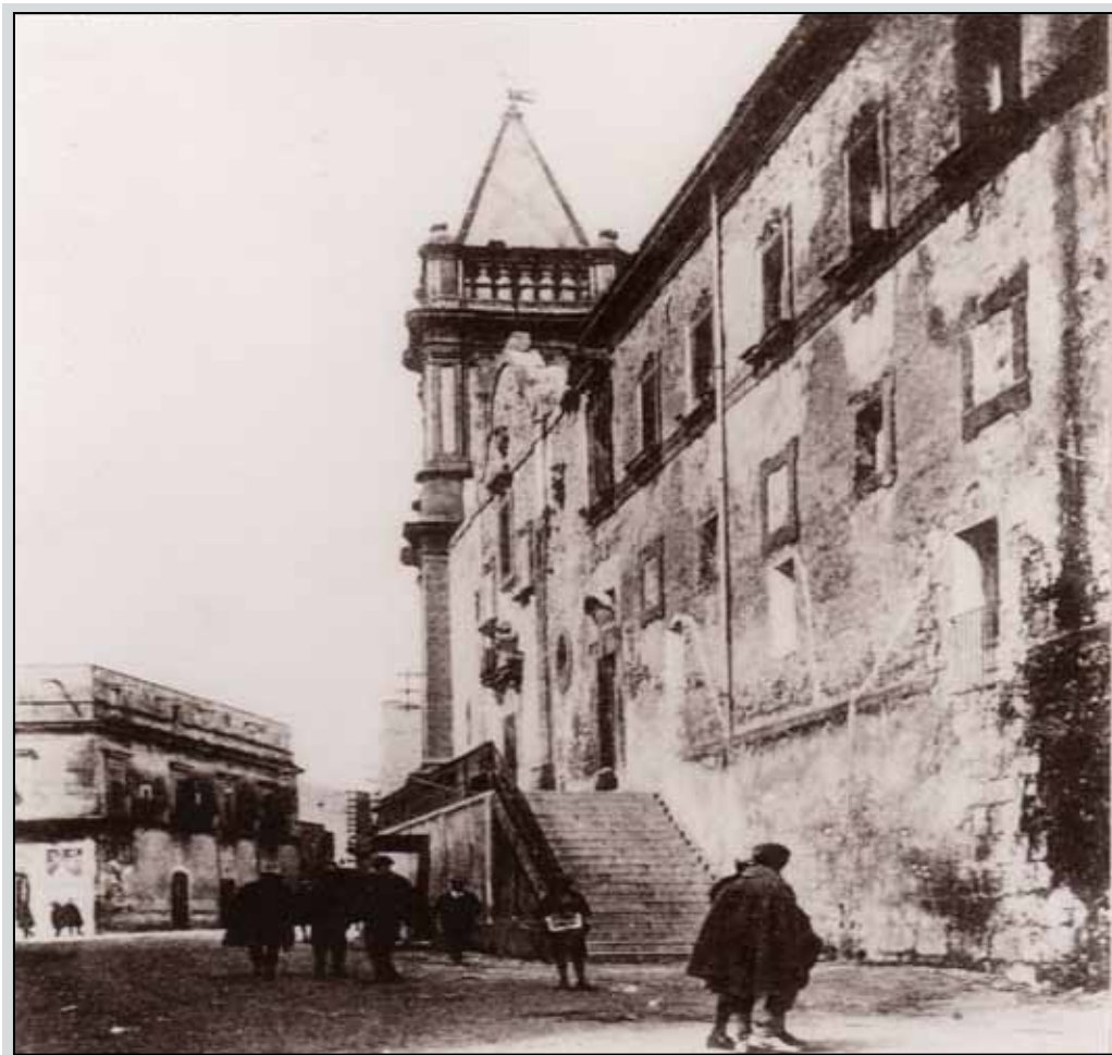
Ex Convento di San Francesco, sede della Scuola elementare maschile

L'episodio, quindi, si conclude con un “avvertimento disciplinare”, senza alcuna conseguenza di natura giuridica o economica. Se ciò sia stato dovuto al clamore suscitato o al buon senso delle Autorità non si potrà mai sapere. Si intuisce chiaramente, invece, l'intendimento politico ed ideologico che quel fatto, apparentemente banale, sottintende.