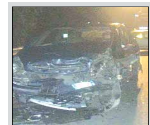
L'ultimo tragico incidente sulla SS 115 tra Ribera e Sciacca

bevande a base di alcool perfino nei distributori automatici. Per concordare altre iniziative unitarie, tra i comuni che vanno dai paesi della Valle del Belice fino ad Agrigento, come l'istituzione di un servizio comune della polizia municipale, fornita di etilometro, il comune di Ribera ha programmato una riunione degli amministratori comuni di 20 comuni presso la sala giunta del palazzo comunale riberese per mercoledì 18 marzo.