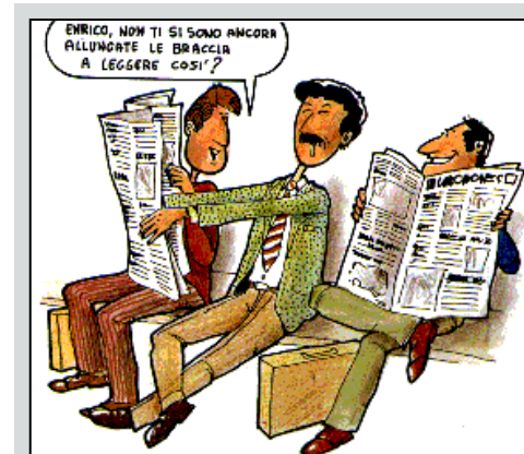
Uno dei tanti fumetti sulla presbiopia

L a presbiopia è il difetto visivo più diffuso e 3 italiani su 4 non sanno come curarsi, rischiando così di compromettere la salute dei propri occhi; così si è espresso il Consorzio Comunicazione Vista rendendo noti alcuni dati sul rapporto che lega la nostra penisola agli occhiali; da questi emerge una situazione tutt'altro che rosea. Una ricerca di CRA svolta su un campione nazionale ha messo in luce che il 71,2% della popolazione oltre i 40 anni soffre di almeno un difetto visivo (tra presbiopia, miopia, astigmatismo e ipermetropia). Di questi quasi la metà (44,3%) è colpito da presbiopia, ovvero la difficoltà nel mettere a fuoco oggetti e testi vicini a noi, tipica e comune tra gli individui che hanno superato i quarant'anni d'età. Questo valore è pressoché trasversale tra uomini (47%) e donne (42%). L'allarme, però, giunge quando si scopre che la prima fonte di informazione dei nostri connazionali in merito alla vista è il passaparola, che nel 44% dei casi è anche il solo metodo tramite il quale si scelgono gli occhiali per se stessi o i propri cari.