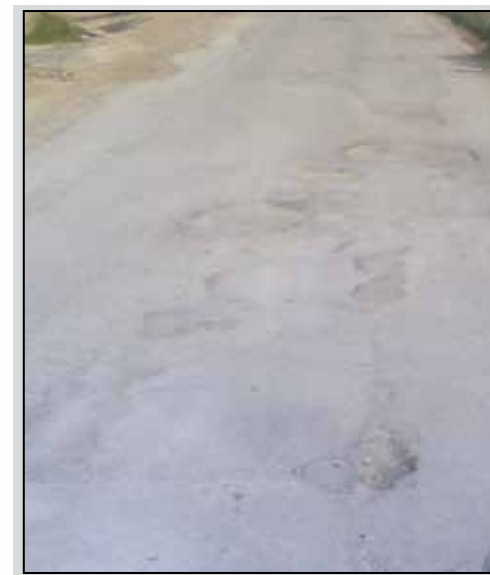
Buche della strada che collega via Partanna con l'autostrada

L e buche presenti nella strada che congiunge l'arteria per Partanna con l'autostrada e la zona commerciale sono state prontamente ricoperte su incarico dell'amministrazione comunale di Castelvetro dopo la nostra segnalazione contenuta nel n. 3 di Kleos (7 febbraio scorso). La stessa cosa è avvenuta, sia pure con molto più ritardo, nella strada di San Martino che collega Partanna con Castelvetro la cui manutenzione dipende dal comune di Partanna e le cui buche avevamo segnalato nello stesso numero della rivista. Senonché le buche della strada di San Martino continuano ad essere chiuse, quelle della strada di collegamento con l'autostrada e l'area commerciale già sono, all'inizio della strada, senza asfalto come prima, come si evince dalla foto qui pubblicata.