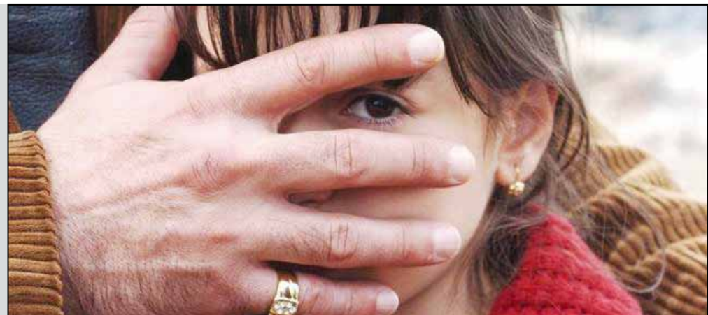
La locandina del film di Marco Amenta "La siciliana ribelle"

- gli indagati furono prosciolti): dentro, un monumento ai tesori locali, l'ulivo e la vite. Ci sono due commemorazioni il 26 luglio, quella ufficiale in chiesa e quella al cimitero, voluta dall'associazione antimafia Rita Atria". L'accusa rivolta a Partanna è di essere una città che vuole dimenticare un certo suo passato. Sarà forse vero e potrebbe anche essere utile fare tesoro di questi "affondi" nazionali sulle "carni" locali per prenderne coscienza, evitare di dare occasione per far parlare male di sé e per avere in ultima analisi le carte a posto per potere discutere, agli occhi di chiunque finalmente a buon diritto e con giustificato orgoglio, delle cose positive del paese (alcune delle quali citate dal sindaco, dall'assessore alla cultura, dalla presidente dell'associazione femminile e dal preside) senza il timore di essere continuamente criticati per la "rimozione" del passato e per l'immagine irrimovibile di paese di mafia di cui si deve parlare solo per questo. A Partanna c'è anche altro (dai tesori archeologici di Contrada Stretto al Castello medievale, alla Chiesa Madre, all'olio, al vino, al miele, ecc.). L'ideale sarebbe che i locali riuscissero a far parlare i giornali nazionali anche di quest'altro (sul tema interviene il prof. Pino Crinelli a p. 7).